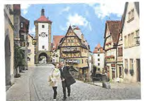
Rothenburg ob der Tauber on the Romantic Road