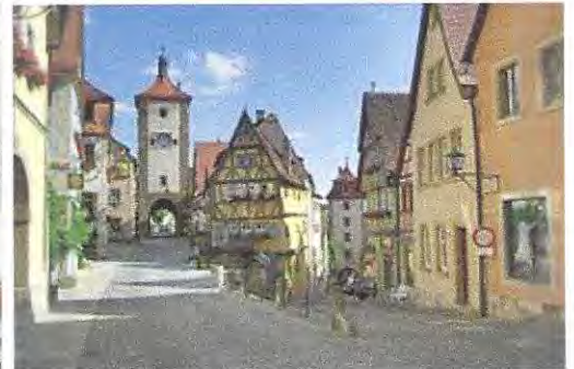
Plönlein with Kobolzeller Steige and Spitalgasse