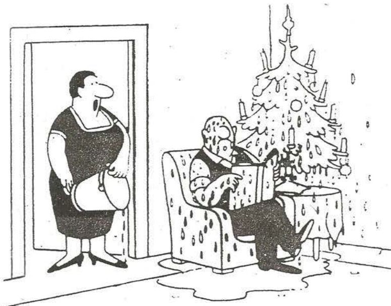
„Mir war so, als ob du »Feuer! Feuer!« gerufen hättest!“

D-----I thought I heard you yell "fire!" "fire!"