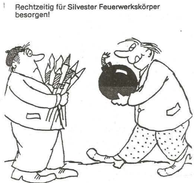
Rechtzeitig für Silvester Feuerwerkskörper besorgen!