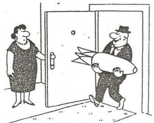
„Dieses Jahr feiern wir mal richtig Silvester!“