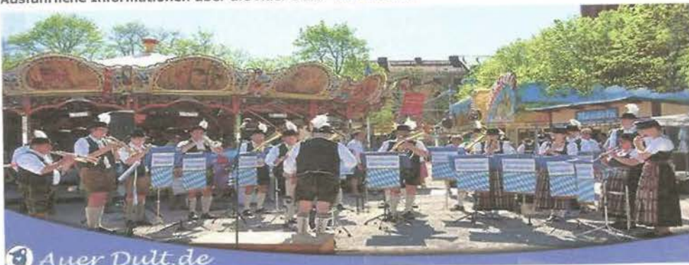
RÜCKBLICK: Auer "Mai" Dult vom 27.04 - 05.05.2013 auf dem Mariahilfplatz in München

Die Auer "Mai" Dult ist die erste der drei Dulten, welche auf dem Münchner Mariahilfplatz stattfindet. Sie eröffnet das Dultjahr 2013 und findet vom 27.04 bis 05.05.2013 in der Zeit von 10 bis 20.00 Uhr statt. Ausführliche Informationen über die Auer Dult - hier klicken