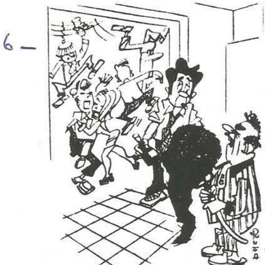
„Ich bin Ihr Untermieter und habe gedacht, vielleicht brauchen Sie etwas Heu für Ihre Herde Elefanten hier oben.“