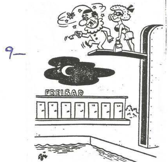
„Komisch - hick - ich finde das Schlüsselloch nicht.“