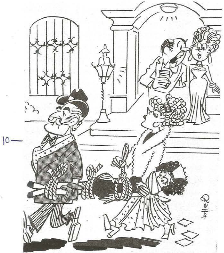
„... ein paar silberne Löffel gingen immer schon mal mit, aber daß man jetzt auch noch die Dienstboten kauft...“