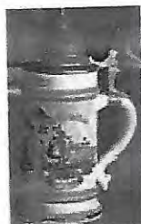
A late-19th-century German beer stein.

For the purist, the stoneware stein (right). The three-litre giant comes out occasionally, but the litre and half-litre sizes are more common. The half-litre size is shown in a traditional shape and a more modern version. The smallest stein holds a quarter-litre.